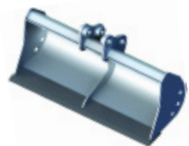
svahovacia lopata DC1

Vyrábajú sa v prevedení ako HD (Heavy Duty) .