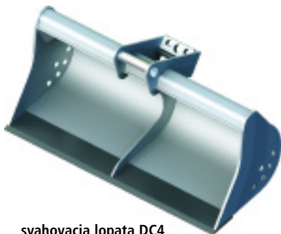
svahovacia lopata DC4