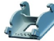
Für den Anschluss an den Schnellwechslers Für den Anschluss an den Schnellwechslers Lehnhoff CW