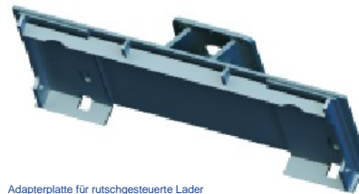
Adapterplatte für rutschgesteuerte Lader