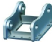
Zur direkten Bolzenbefestigung

Die Adapterplatten werden für den Anschluss hydraulischer Hämmer und Scheren an die Maschine verwendet. Sie können mit Aufhängungen für die Befestigung auf den Schnellwechslern montiert werden.